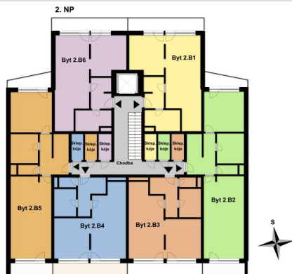
Byt 2. B2